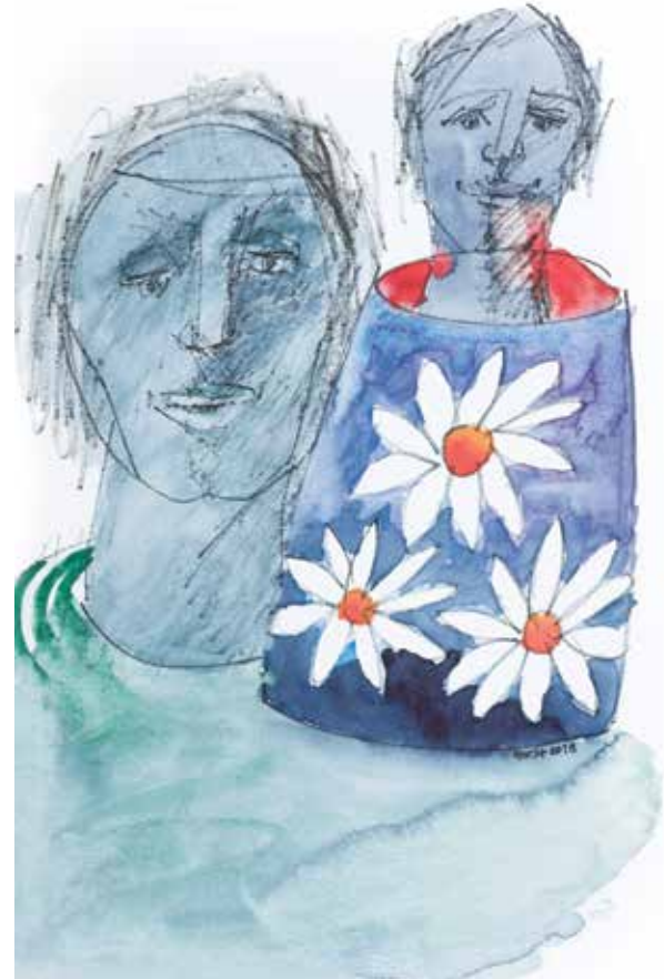
„Befangen“, Mischtechnik, 60 x 40 cm, 2018