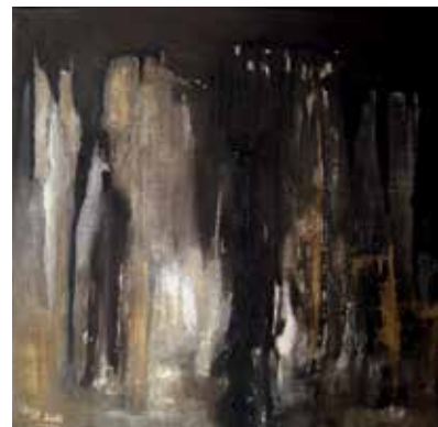
Tiefgründig, 40 x 40 cm