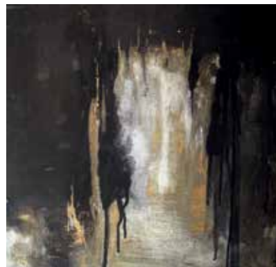
Rätselhaft, 40 x 40 cm

Kampenwandstraße 1 85586 Poing 08121 - 71844 kornelia.boy@t-online.de www.kornelia-boy.de