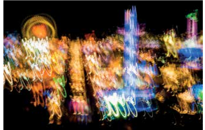
The big wheel

Eichenweg 4 85586 Poing 0151 50675505 raphotography@mac.com www.robantony.net