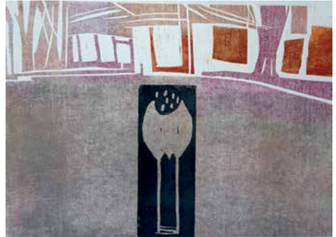
Holzschnitt 60 x 50 cm auf Papier