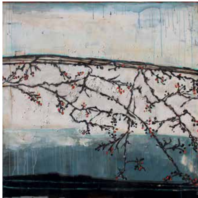
Natur 1 /2019

Kampenwandstraße 1 85586 Poing 08121 - 81237 rosemarie.hingerl@web.de www.rosemarie-hingerl.de