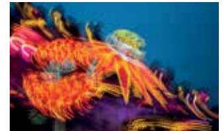
Ride at Oktoberfest