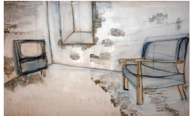
lost places - in process

geboren 1960 in Schaffhausen/Schweiz 1980-86 Architekturstudium FH München 1987-88 Aufbaustudium Denkmalpflege TU München 1980-82 Reisen nach Westafrika 1991 Mitglied der Bayerischen Architektenkammer und selbstständige Tätigkeit als Architektin, seit 1993 Einzel- und Gemeinschaftsausstellungen, ab 2000 Mitglied in der Gruppe Projekt IV, seit 2005 'Atelier im Osterfeld', seit 2006 Mitglied im Kunstnetzwerk Poing, 2012 Ausstellung 'Umgebungen' mit Hans Mayrhofer 2013 Gemeinschaftsausstellung "statt landschaft II" – Team 2+ Architekten München 2013 - 2015 KUNSTSTOFF