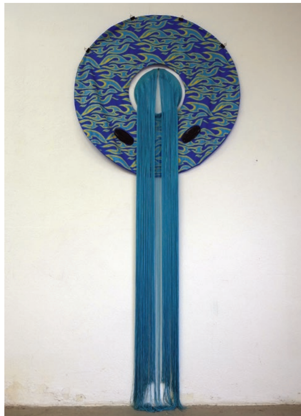
Madonna Mare, 2015 verschiedene Kunststoffe, Metall, h 3m, b 1,20 m

Kirchenweg 11 85646 Anzing /Frotzhofen 089 - 52389254 www.katrinsiebeck.de