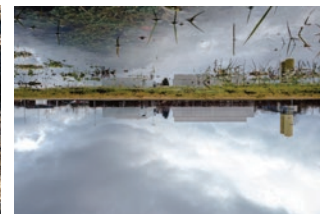
Am großen Wasserhimmel