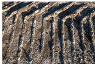
Feldrelief - An der Leiten