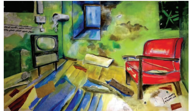
lost places - in process

«Kunst gibt nicht das Sichtbare wieder, sondern macht sichtbar.» Paul Klee