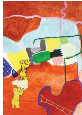
„bärig hinauf“ 48 x 68 cm

Hartholzweg 14 85599 Parsdorf 089 - 9037407 0170 - 2445342 info@ulrikepfeiffer.de www.ulrikepfeiffer.de