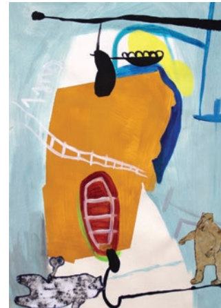
„bärig hinaus“ 48 x 68 cm