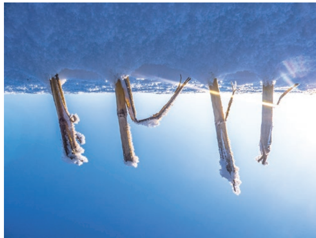
Feldsoldaten im weissen Kleid

*) Lothar Müller, Ballenpresse, SZ, 29./30. August 2015